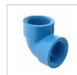
CODO HI / HI