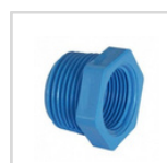
BUSHING HE / HI