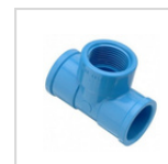
TEE PEGAR / HI