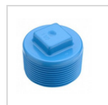
TAPA TORNILLO HE