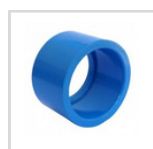
BUJE REDUC. CORTO