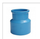
BUJE REDUC. LARGA