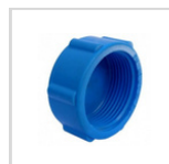
TAPA TORNILLO HI